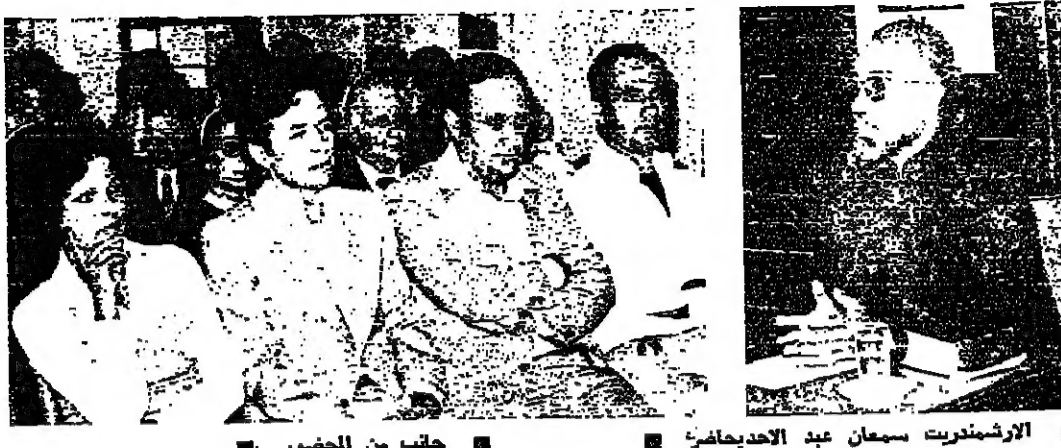
الاربعين من الحضور

اربعاء ثقافية وفنية وبنيابية . غنار الاثنين اسبوع اعياد الكرمية الذي احيته طيلة اسبوع اعياد الكرمية والذي كان من اهم الاحتفالات التي شهدتها المدينة بعد الحوادث ، حيث تحول الى مظاهرة فعليه عبرت من مدى تمسك الزحلي باعياده السنوية التقليدية . وهذه السنة اشرفت على تنظيم الاسبوع الفنون الزحلية مما اعطاه